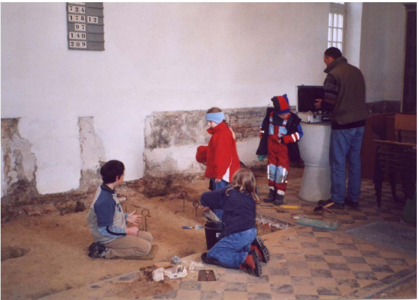
Kinder erkunden die Vorzeit (... der Glasower Kirche)