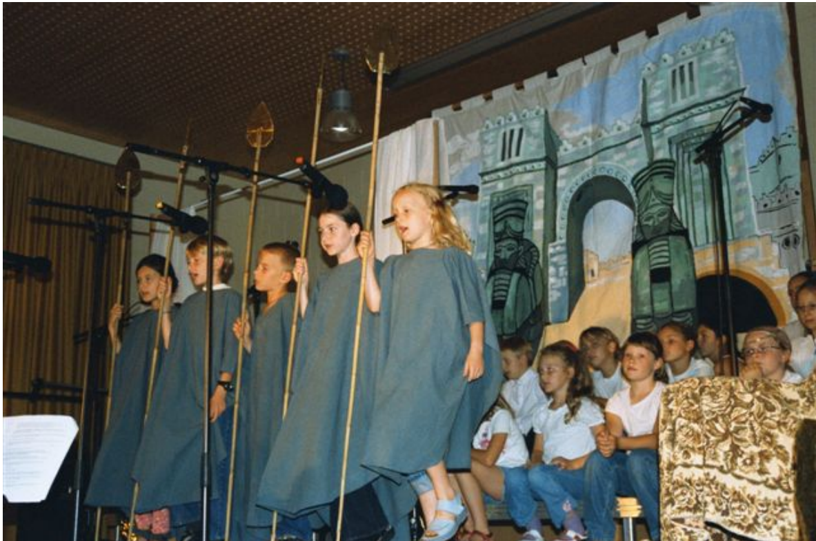
Ester, Königin von Susa - Aufführung von Kindern unserer Gemeinde in der Kinder-Singwoche